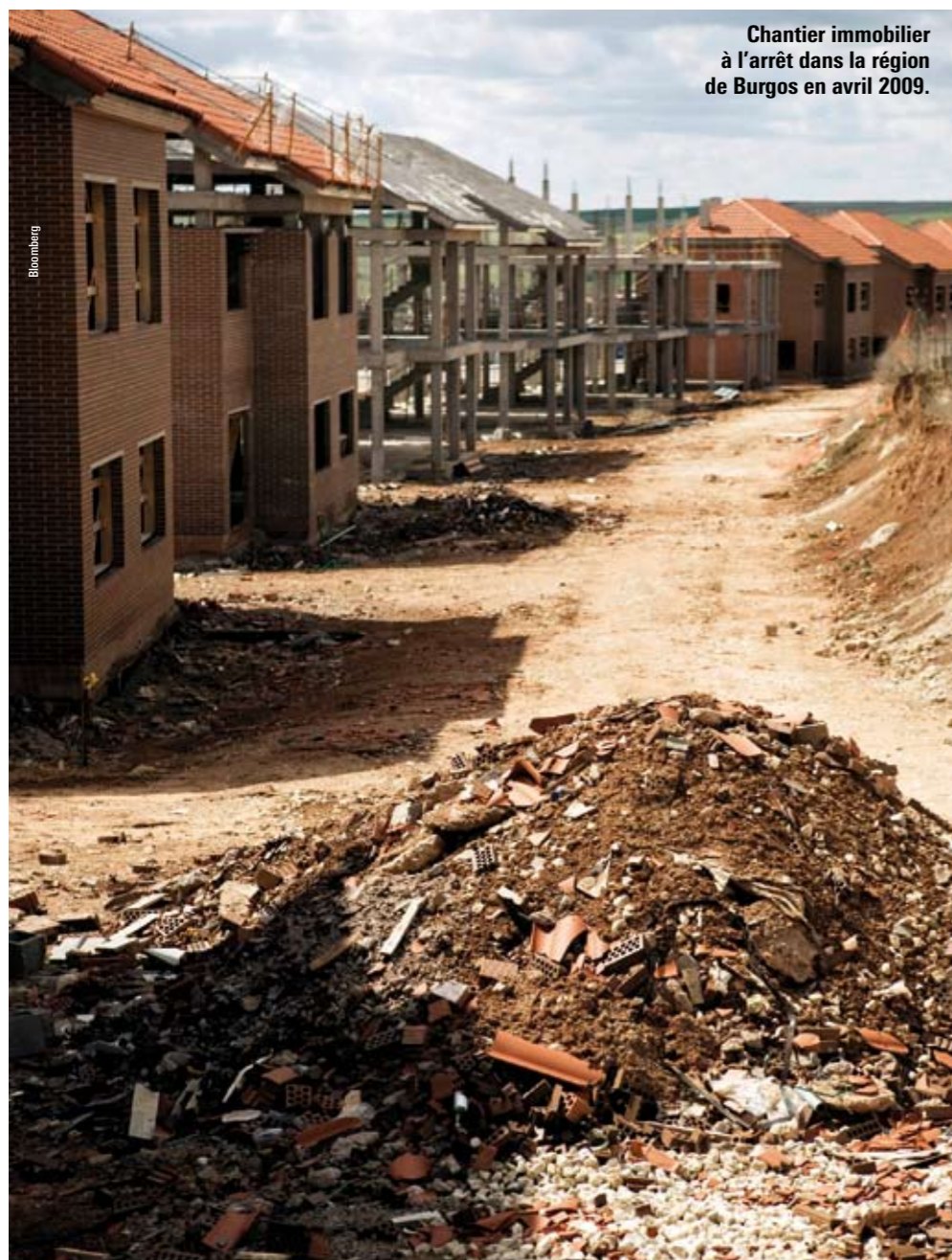
Chantier immobilier à l'arrêt dans la région de Burgos en avril 2009.

La Commission européenne n'attend pas le retour de la croissance dans ce pays avant 2011.